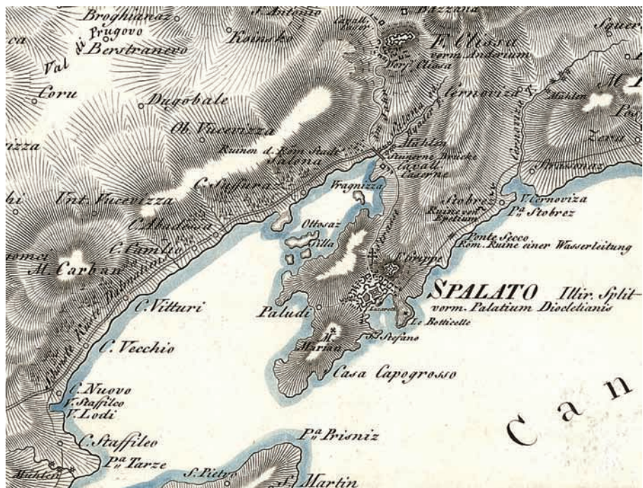
M. de Traux, Splitsko područje na karti Dalmacije, 1810.