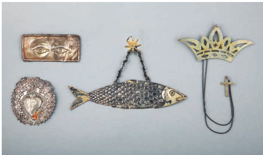
Zavjetni darovi u crkvi Gospe od Pojišana, XVIII. stoljeće

Aspekt života pomoraca jednako njegovan na moru kao i na kopnu – njihova je duhovna dimenzija. Da je u minulim stoljećima bila važan dio pomoračkog života, svjedoče priručnici za prakticiranje vjerskog života namijenjeni pomorcima, a slični molitvenici tiskaju se i danas.