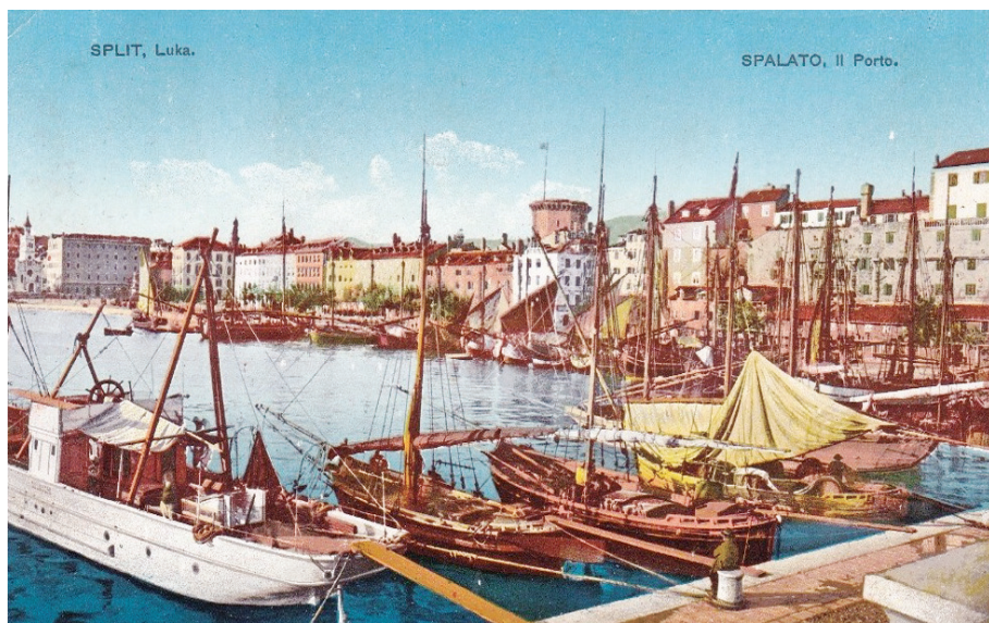
Splitska luka, početak XX. stoljeća

U prvom razdoblju, putovanja u Split i Dalmaciju organizirala su različita društva iz Monarhije, a sredinom devedesetih godina i sam se Lloyd javlja kao organizator. U svibnju 1892. godine zabilježen je dolazak u Split i prvog turističkog parobroda pod engleskom zastavom, luksuzne parne jahte Victoria sa 71 putnikom. Nakon nje, u Split su redovito počeli pristajati i drugi engleski, te njemački i francuski putnički parobrodi. Samo tijekom proljetnih mjeseci 1906. godine, u Splitu su u više navrata boravili engleski parobrod Vectis i njemački Meteor i Victoria Luise . Broj