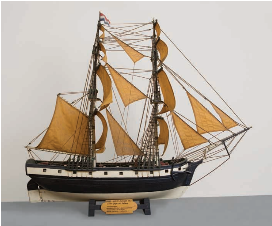
Model brika u crkvi Gospe od Pojšana, XIX. stoljeće

Brojna nastojanja Aleksandra Königa, uglednog austrijskog poduzetnika s kraja 19. stoljeća, da upozori vladine krugove Beča na važnost eksploatacije Dalmacije i Jadranskog mora, nisu mogla bitnije utjecati na gotovo alarmantno zapostavljanje pokrajine na periferiji Austro-Ugarske Monarhije. Dualistička podjela Habsburške Monarhije učvrstila je zid diobe između Dalmacije i njezina zaleđa, pa su sva nastojanja da se takva situacija omekša izazivala otpor i Beča i Budimpešte. Spori razvitak domaćeg poduzetništva zrcalio je skromne rezultate u manjim ili srednjim poduzećima, kao i u pomorskoj privredi (brodogradnji i brodarskoj djelatnosti) u vrijeme jedrenjaka, dok je veći udio kapitala izvana (talijanski, austro-njemački i