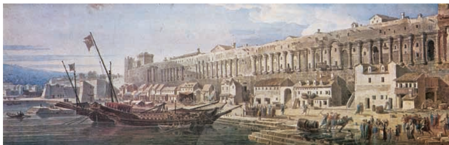
L. F. Cassas, Splitska luka, 1782.

Kapela je postojala do 1808., kada je srušena, ali je odmah sagrađena nova uz jugozapadnu kulu lazareta, tj. generalata. Ta je pak postojala do pedesetih godina 19. st. kada je i ona srušena.