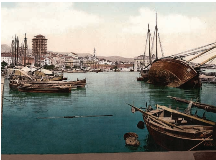
Matejuška, kraj XIX. stoljeća