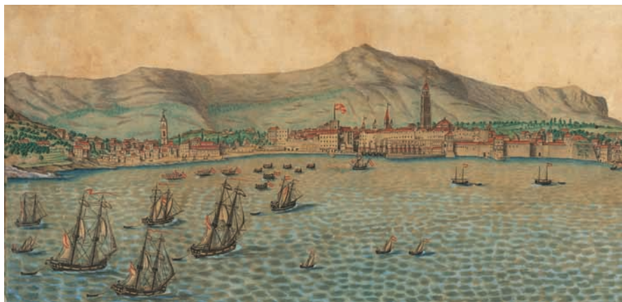
A. Barač, Dolazak cara Franje I. i carice Karoline Auguste, 1818.

Ovaj rad otkriva promjene organizacijske strukture i strategije izolacije u splitskom lazaretu koje su bile povezane s percepcijom bolesti.