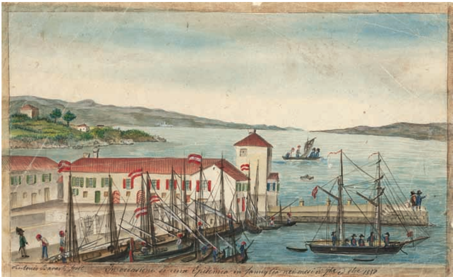
A. Barač, Splitska luka, 1850.

Usporedno je, uz izgradnju grada i gospodarski uspon, društveni život postajao dinamičniji. U referatu će se, na temelju izvorne građe, tiska i relevantne literature, prezentirati bogati društveni život u splitskoj luci u drugoj polovici 19. stoljeća.