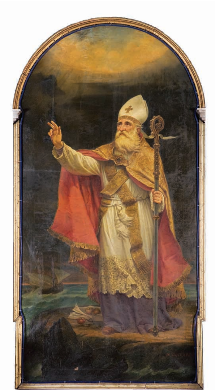
A. Zuccaro, Slika sv. Nikole u crkvi Gospe od Pojišana, 1881.