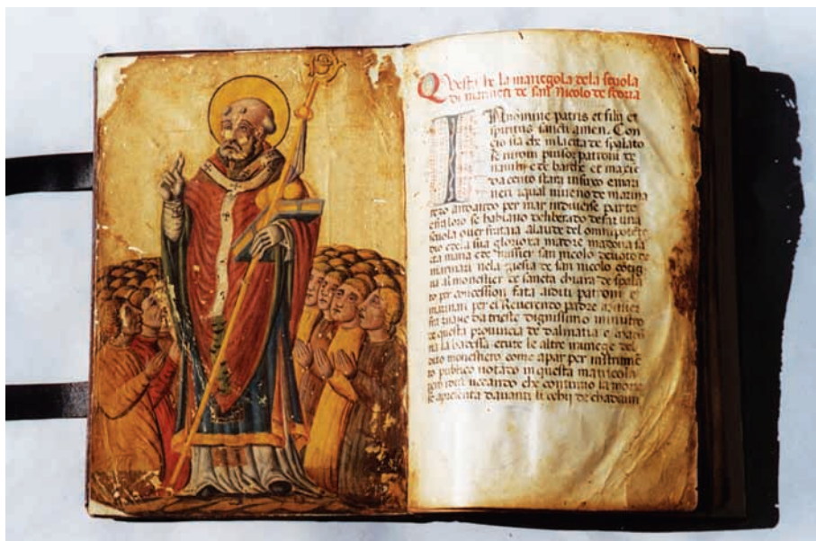
Pravilnik bratovštine pomoraca sv. Nikole, šezdesete godine XV. stoljeća

Nakon navođenja vrela koja su utjecala na razvoj pomorskog prava, autorica analizira položaj brodskog osoblja, stvarna prava na brodu, ugovore o iskorištavanju broda, pomorski zajam, havariju, pružanje pomoći na moru i spašavanje te ostale značajne pomorske institute.