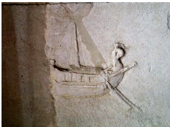
Stela Gaja Utija iz Salone s prikazom broda, I. stoljeće

Međutim, nepovoljan je pristup izvan samog Salonitanskog zaljeva. To je razlog zašto je Salona trebala pomoć s druge strane splitskog poluotoka. Splitska je luka mogla brodove primati i opskrbljivati vodom, a potom ih slati na prekreaj u Salonu. Da bi se te dvije luke međusobno sporazumijevale, bilo je potrebno organizirati sustav signalizacije (svjetionicima). Zato je i postojala Praefectura phariaca salonitana koja nije, kako se često misli, upravno tijelo grada Farosa (Stari Grad) koji je, kako se danas zna, imao svoju vlastitu gradsku samoupravu. Taj sustav međusobne organizacije morao je dugo trajati.