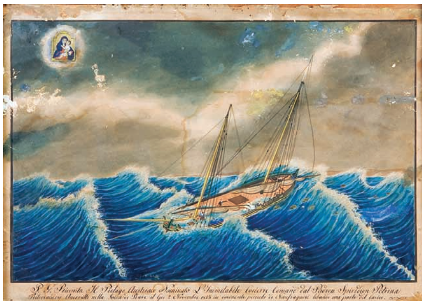
Zavjetna slika peliga Špire Petrine, 1844.

U Državnom arhivu u Splitu te u arhivu Hrvatskog pomorskog muzeja Split sačuvana je građa – dokumentacija, pravilnikom određene evidencije i propisani obrasci koje je lučki ured bio obvezan voditi. Ta građa sadrži registre brodova, popise momčadi i najamne ugovore na plovilima kao i zahtjeve pomoraca za izdavanje dozvole za plovidbu. Analizom registra saznajemo ponešto o prometu u splitskoj luci, o manjim brodovima (bracere, bragoci, gaete, golete, leuti, logeri, pelizi) koji